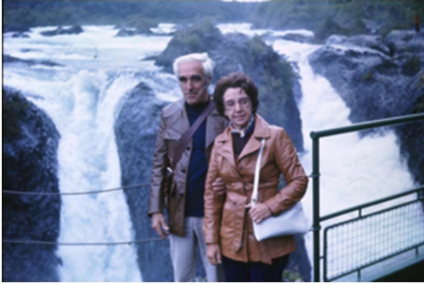
Voyage au Chili en 1975