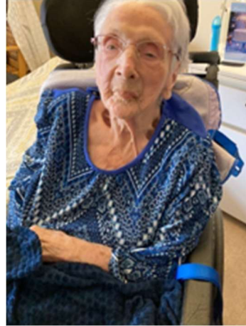
22 août 2022 lors de son centième anniversaire