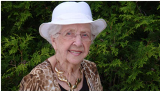
Photo au chalet de Métabetchouan